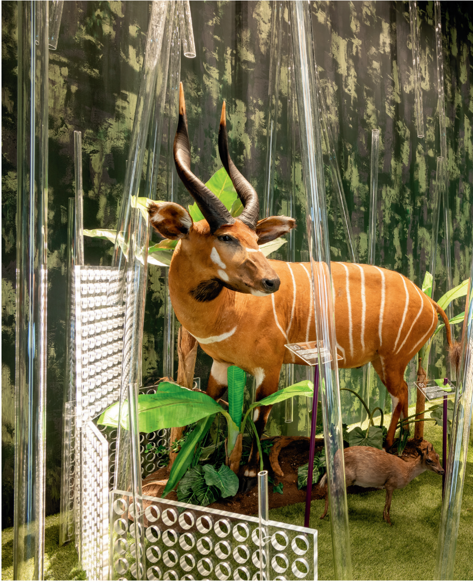
Vasáros Zsolt: Dzsungel