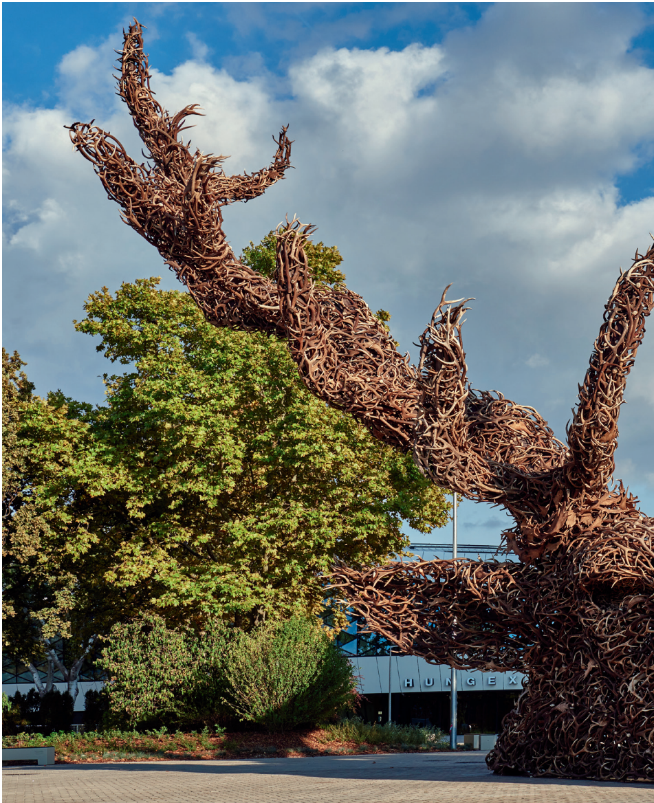
Szőke Gábor Miklós: Totem