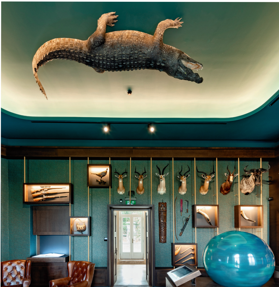
Vasáros Zsolt: Szivarszoba