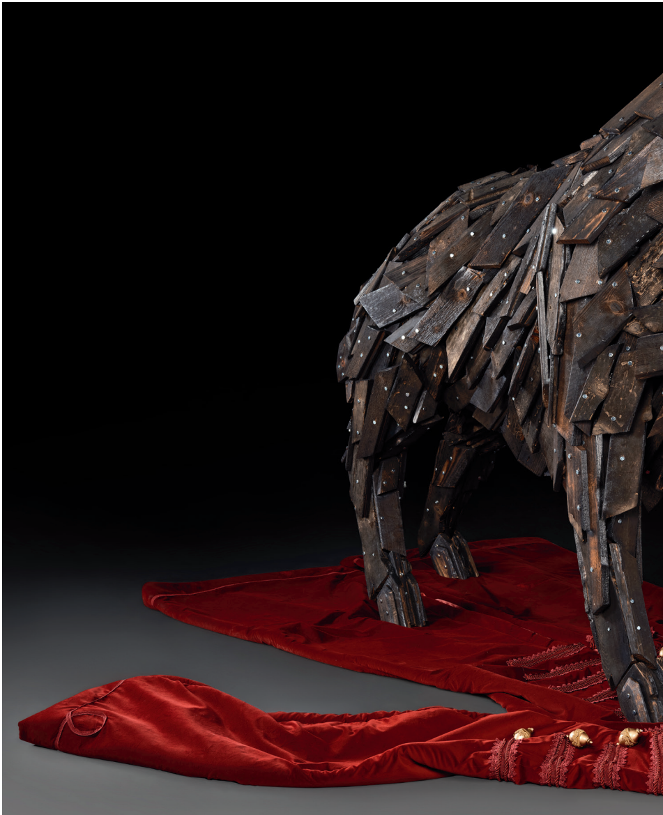
Szőke Gábor Miklós: Zrínyi halála