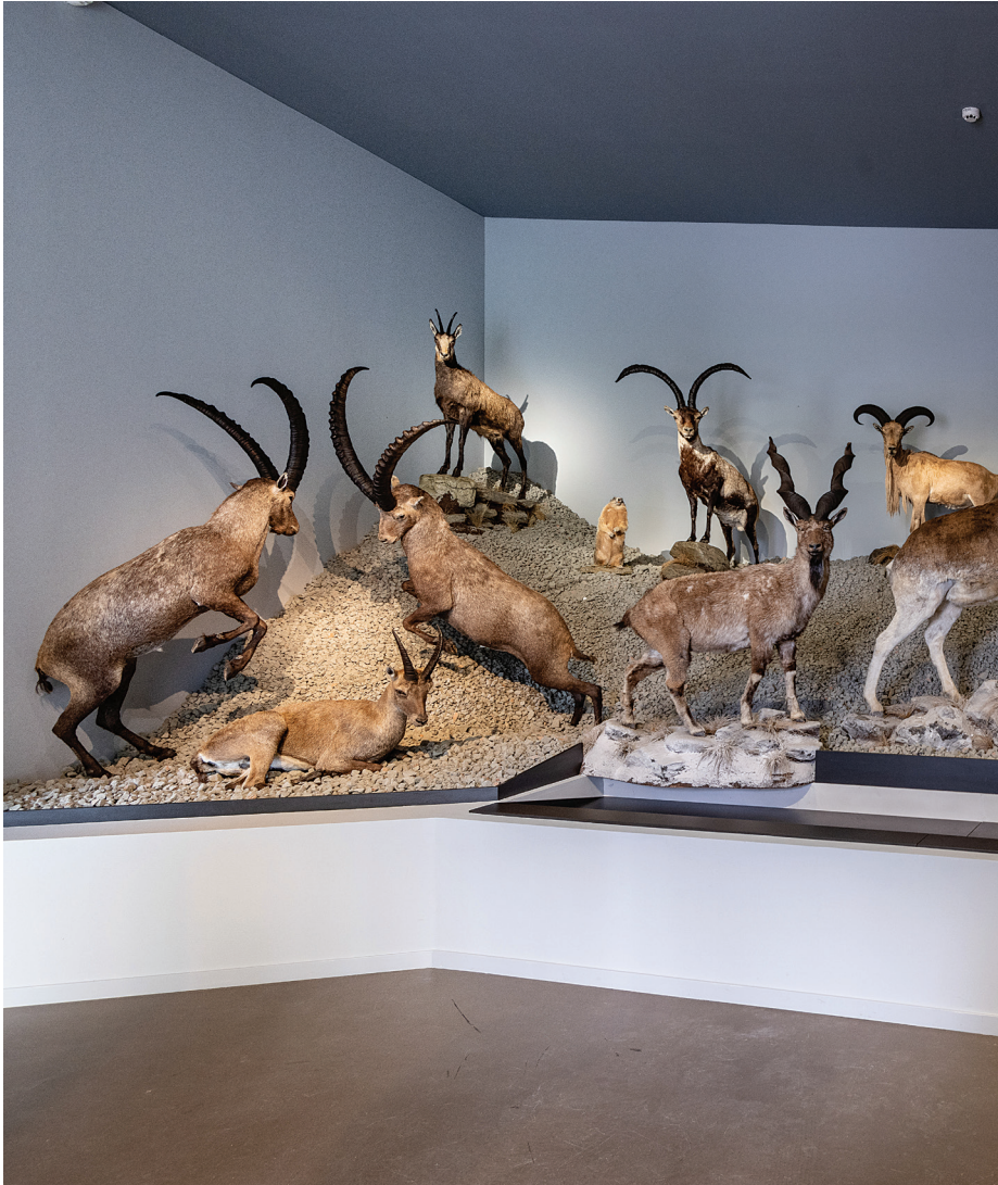
Zsolt Vasáros: Plai alpin