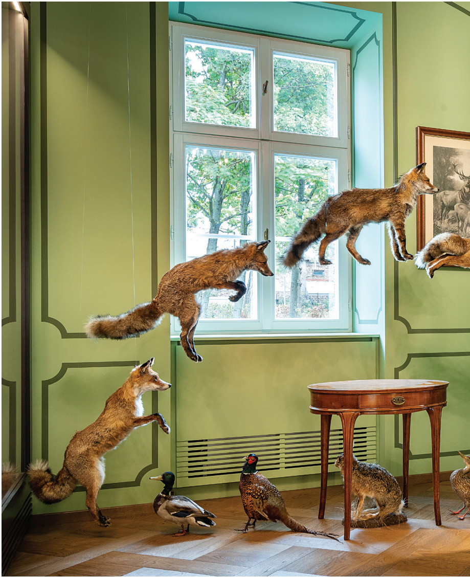
Zsolt Vasáros: Camera vânătorului