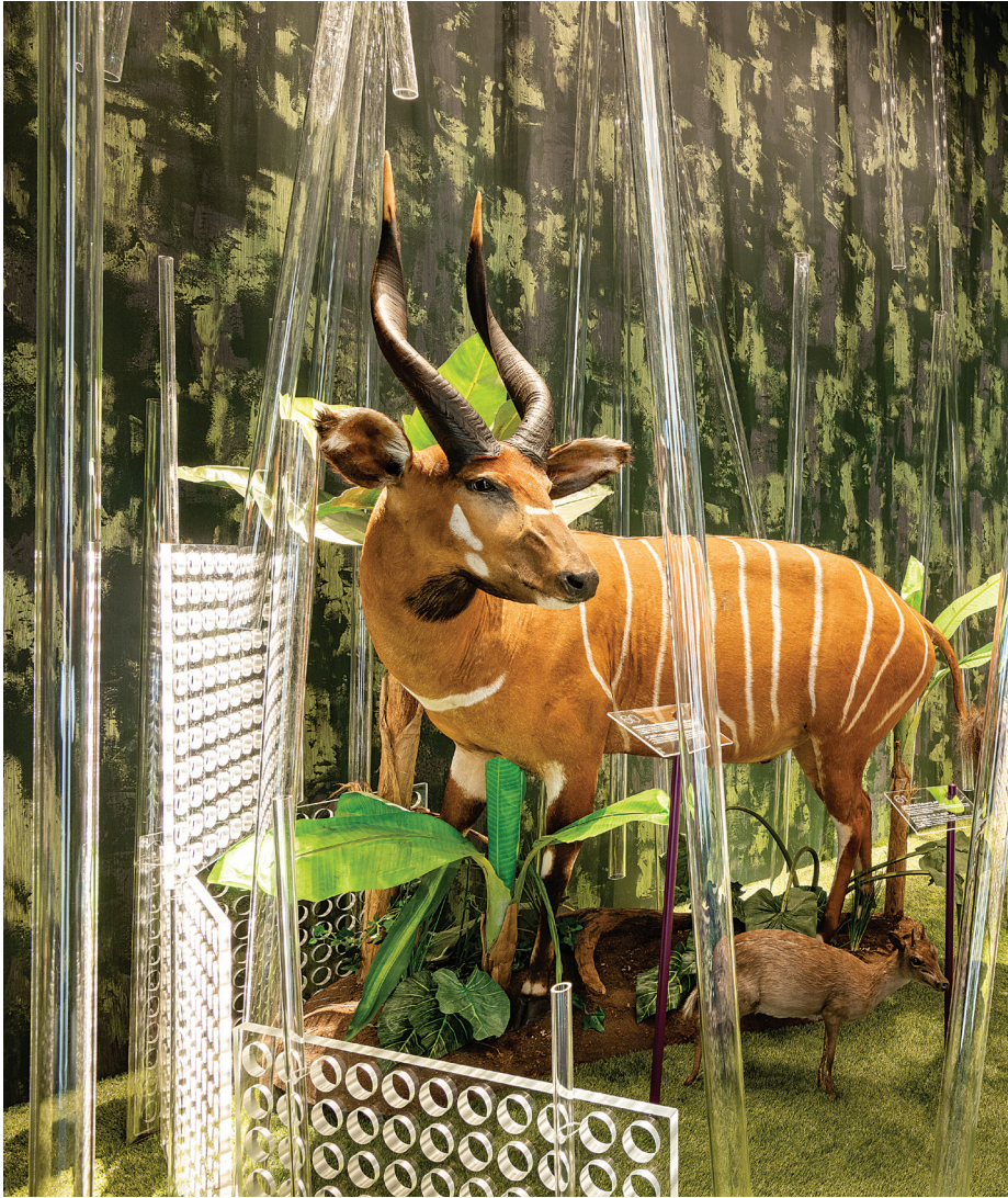
Zsolt Vasáros: Junglă