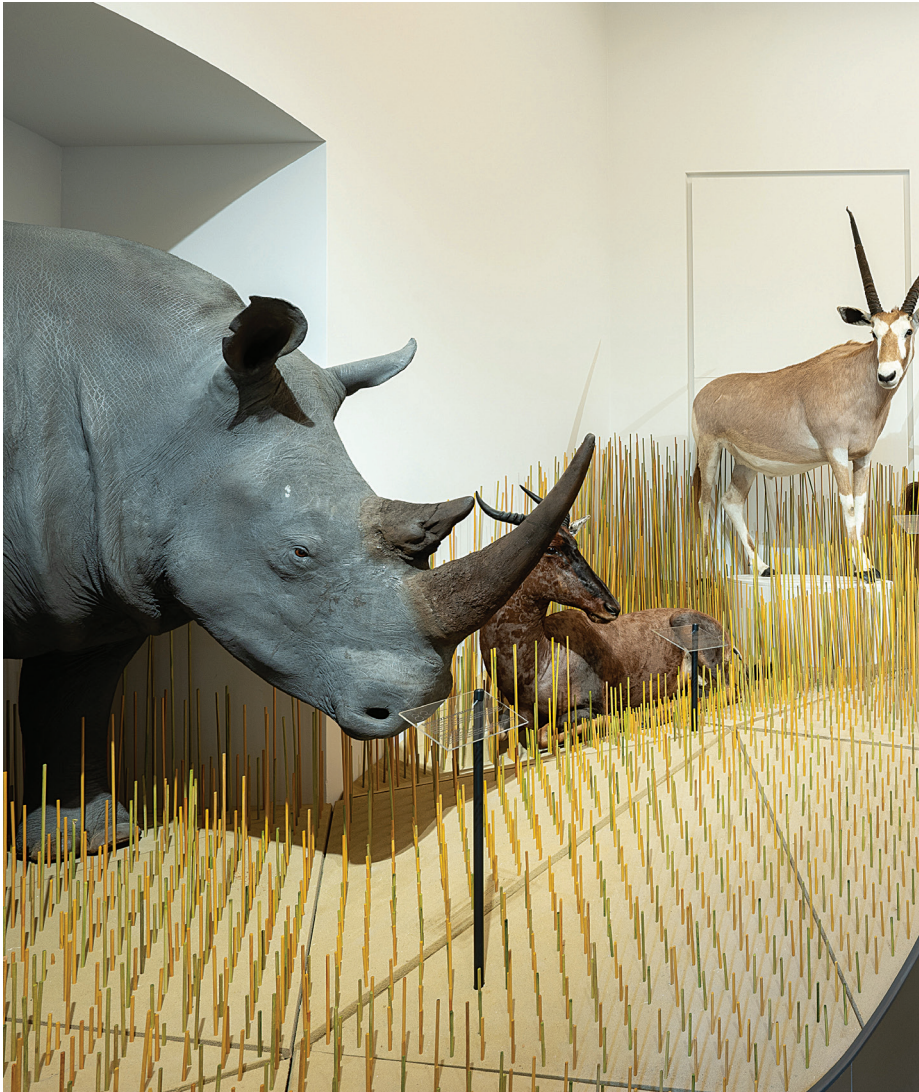
Zolt Vasáros: Savană