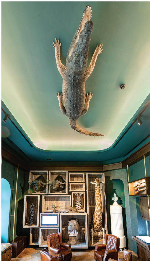
Zsolt Vasáros: Salon pentru fumat