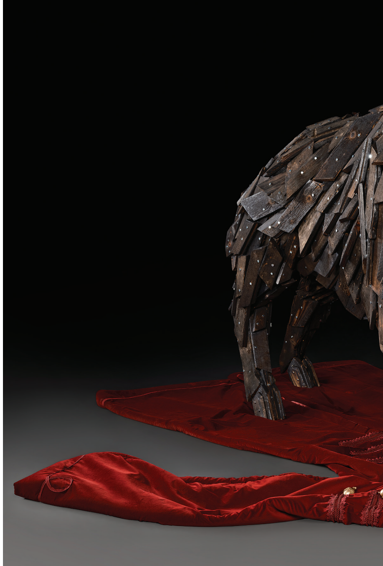
Gábor Miklós Szőke: Moartea lui Zrínyi 1