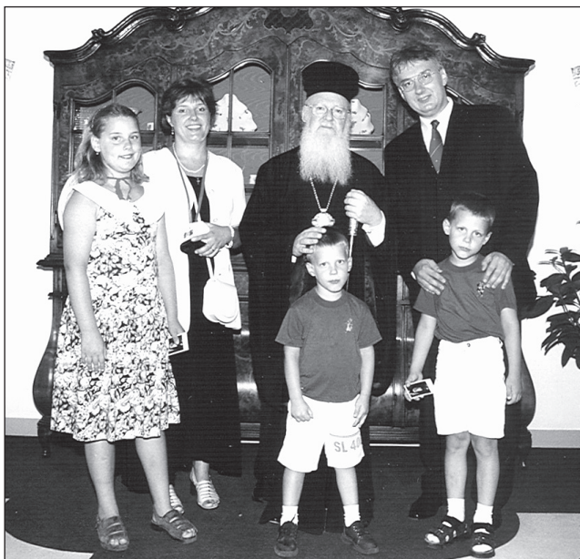
I. Bartholomaiosz patriarcha vendége a Semjén család