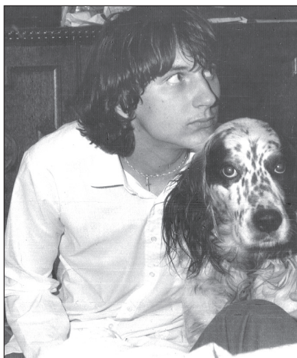
A Szilágyi Gimnáziumban, 1980

– Nincs. A természetes ellentéte nem a természetfölötti, hanem a természetellenes. Az „egynemű párok házassága” ellentétes a természet rendjével. A cölibátus pedig az Egyház egyik természetfölötti jele.