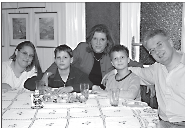
Fotó: Képmás – Hortobágyi Lilla

(Képmás, 2006. január; Az interjút készítette: Szám Katalin)