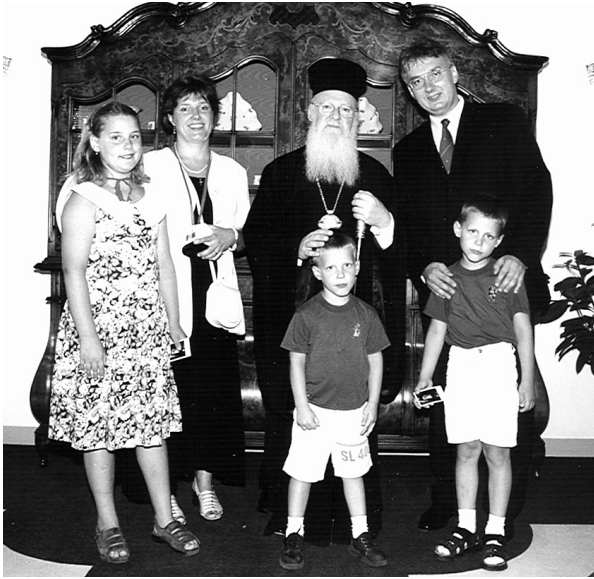
I. Bartholomaiosz patriarcha vendége a Semjén család