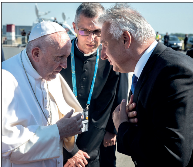
Búcsúzás a Szentatyától 2021. szeptember 12.

őrzésére hívta fel az egész világ közvéleményét. Most, a XXI. században, amikor a klasszikus értékek szétesésének időszakát éljük; amikor egyik napról a másikra emberi egzisztenciák omolhatnak össze, amikor megszokott, kiszámítható életvitelünket – minden technikai fejlettség ellenére – egy pillanat alatt megváltoztathatja egy járvány, biztos fogódzópontot keresünk. Olyan egyedülálló Értéket, amelyre mint sziklára építhetjük az életünket. Amit nem visz el az ár, sem valamely katasztrófa. Ami nem a változó és elmúló emberi álmok labilis alapzatára épül. Amikor a keresztény civilizáció globális megőrzése bizonytalanná válik, akkor a Nemzetközi Eucharisztikus Kongresszus rá-