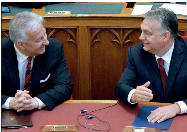
Orbán Viktor miniszterelnök, a Fidesz elnöke és Semjén Zsolt miniszterelnök-helyettes, a Kereszténydemokrata Néppárt elnöke a negyedik Orbán-kormány megalakulásakor a Parlamentben