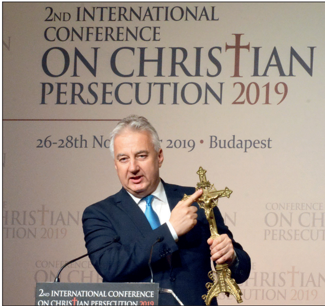
Marcell atya karmelita oltárkeresztje kalasnyikov géppisztolysorozat ütötte lyukkal