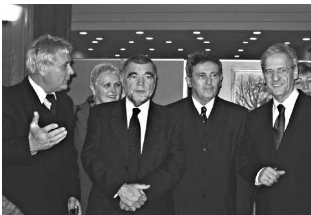
Stjepan Mesic és Sólyom László köztársasági elnökökkel, Országos Horvát Nap, Sopron, 2005

Mindezek tükrében Magyarország meszszenenőig támogatja a horvát uniós csatlakozási tárgyalásokat.