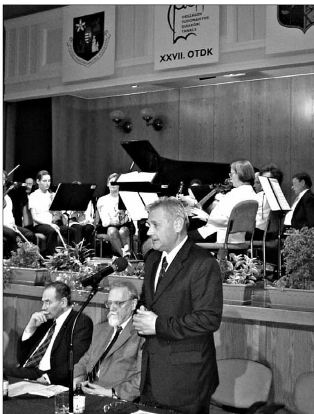
Országos Tudományos Diákköri Konferencián Sopronban

Mennyivel inkább humanizált információkra van szükségük a tanulásban nehézségekkel küszködőknek. Köszönet a cselekvésért, azaz az elkötelezettségért, a vállalásért és a felelősségért.