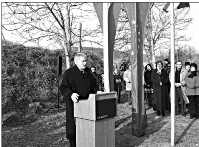
Határnyitás Harka-Sopronnyék (Neckenmarkt) között