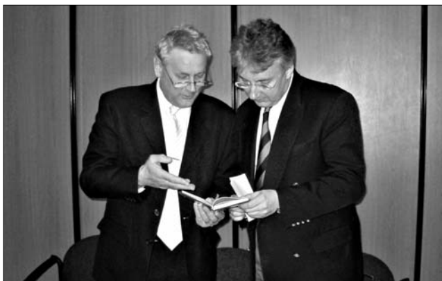
Semjén Zsolttal Sopronban, 2005. április 2.