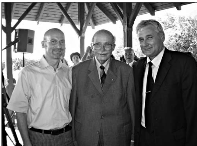
Szájer Józseffel és Habsburg Ottóval a Páneurópai piknik helyszínén

Tegyük azért, hogy ez a jövőben így legyen!