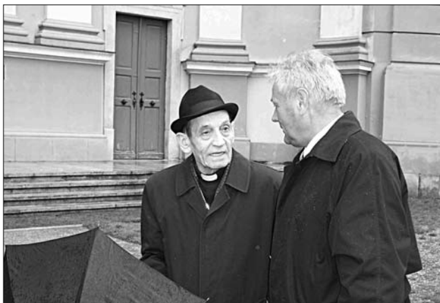
Tempfli József püspökkel Nagyváradon