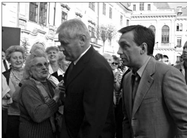
Sopron, Fő tér, 2004

Isten áldja mindannyiukat. Hajrá Magyarország, hajrá Sopron!