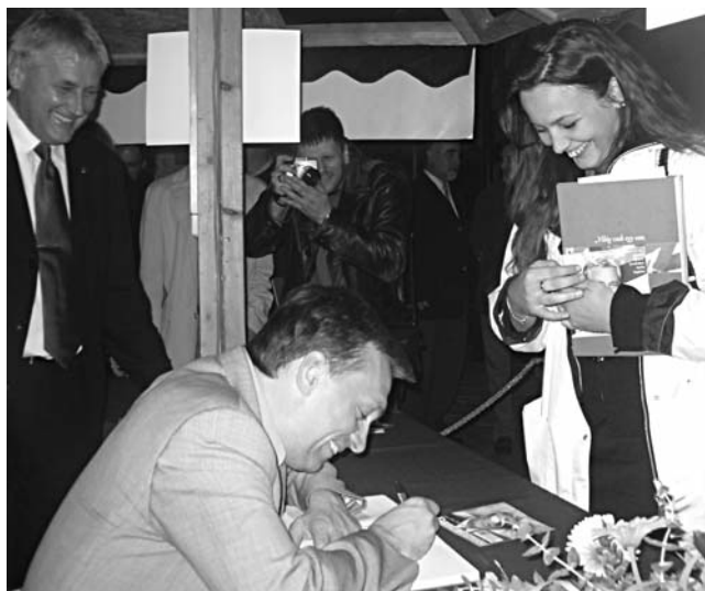
Orbán Viktor Sopron Fő terén dedikál 2004. októberében