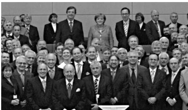
Tanácskozás az Európai Bizottság 2008. évi politikai stratégiájáról, Berlin, 2007

Ha Horvátország ilyen ritmusban halad tovább, az EU-tagság reálisan megvalósítható cél az évtized végére.