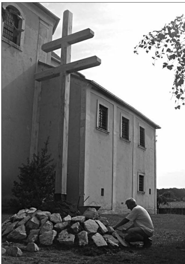
A saját kezűleg épített hármashalom

A haza jövője a lelkekben dől el. Ezért fontos, hogy mi- nekünk kópháziaknak is legyen egy olyan megszentelt je- lünk és helyünk, amely hat a lélekre. Amely emlékezteti az utókort, amely segít megmaradni hitben, reményben, sze- retetben, oltalmat és megtisztulást nyújtó zarándokhelyévé válík minden jóakarató embernek.