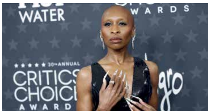
Cynthia Erivo „színésznő”

A progresszív művészi szabadságra való hivatkozással Cynthia Erivo alakítja Jézus szerepét, a Jézus Krisztus Szupersztár új előadásában, de ez már nem a művészi szabadság kérdése, mert ez már nyílt blaszfémia!