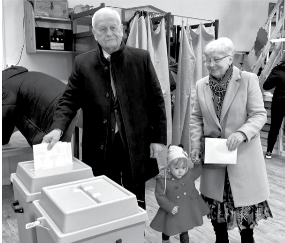
Harrach Péter, az MKDSZ elnöke (bal oldali képünkön) és Semjén Zsolt, a KDNP elnöke is családi körben adta le szavazatát

A Bajnai-féle mozgósítás személyeskedése álságosnak bizonyult, nem jött be. A tábor motiváltságát biztosította a két oldal irányvonala közötti jól látható, és jól láttatható különbség, illetve az a tény, hogy a kormányképesség az egyik oldalon bizonyított, a másik oldalon meglehetősen kétséges volt. A baloldali szavazókat erősen frusztrálta az egység hiánya. Ez egyértelmű következménye volt az ellenzéki struktúrának. A közös célt és víziót – ha volt ilyen egyáltalán – elnyomta az egyéni és csoportérdek. Messziről látszott a széthúzás.