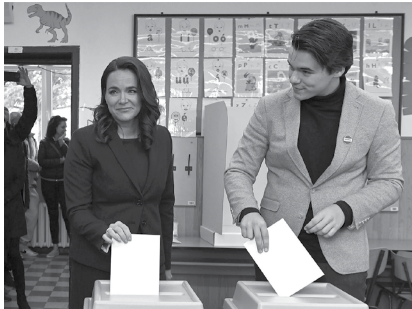
A köztársasági elnökké választott Novák Katalin első szavazó fiával voksolt 2022. április 3-án

A választási autokráciák kialakulása önmagában bizonyítja a