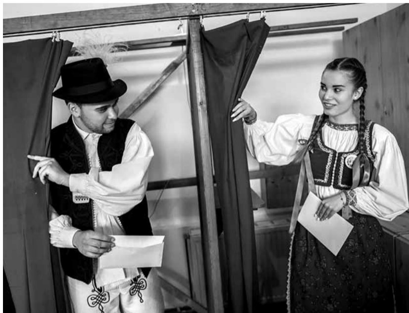
Fiatal szavazók bukovinai székely népviseletben a Tolna megyei Kakasdon 2019-ben

A demokrácia már sokkal körülírhatóbb és megfoghatóbb, hiszen ezer évek álltak rendelkezésére a kikristályosodásának. Ennek ellenére a fogalom dőcög. Ha azt ál-