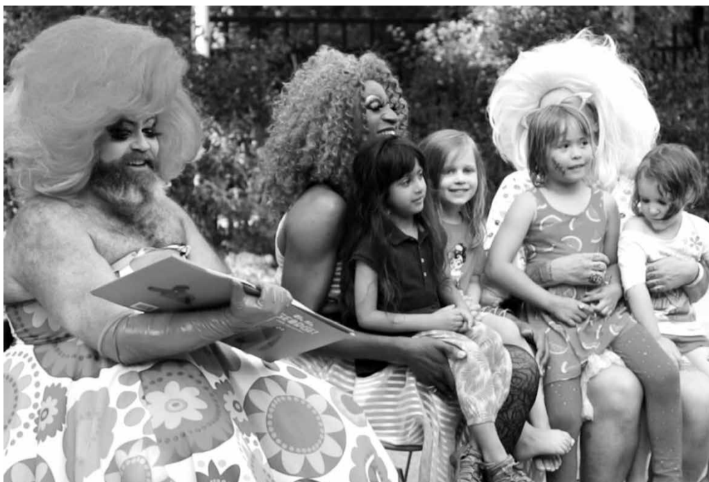
Nyugat-Európában és Amerikában már az óvodások és kisiskolások „LMBTQ-érzékenyítése” is megkezdődött...

ban, amit most márciusban alkotott meg az Európai Parlament, amiben LMBT-szabadövezetté nyilvánították az egész EU területét. Ebben név szerint is nevesítik Magyarországot, mint ahol – úgymond – elnyomják az „LMBT-jogokat”. Valójában semmiféle elnyomásról nem volt szó, csak arról, hogy az akkor előkészületben lévő magyar törvény azt kívánta megakadályozni, hogy a fiatalok nevelésébe kívülről bevigyék ezt a típusú „melegpropagandát”. Az Európai Bizottság pedig összeállított öt éves tervet hirdetett meg az LMBTQ-lobbi követelményeinek uniós szintű keresztülvételére. A kampány mögött bizonyítottan ott vannak az Unió intézményei, és azok az úgynevezett nemzetközi emberi jogi szervezetek, amelyek nemcsak Magyarországon, hanem Európa más országaiban is erre törekednek.