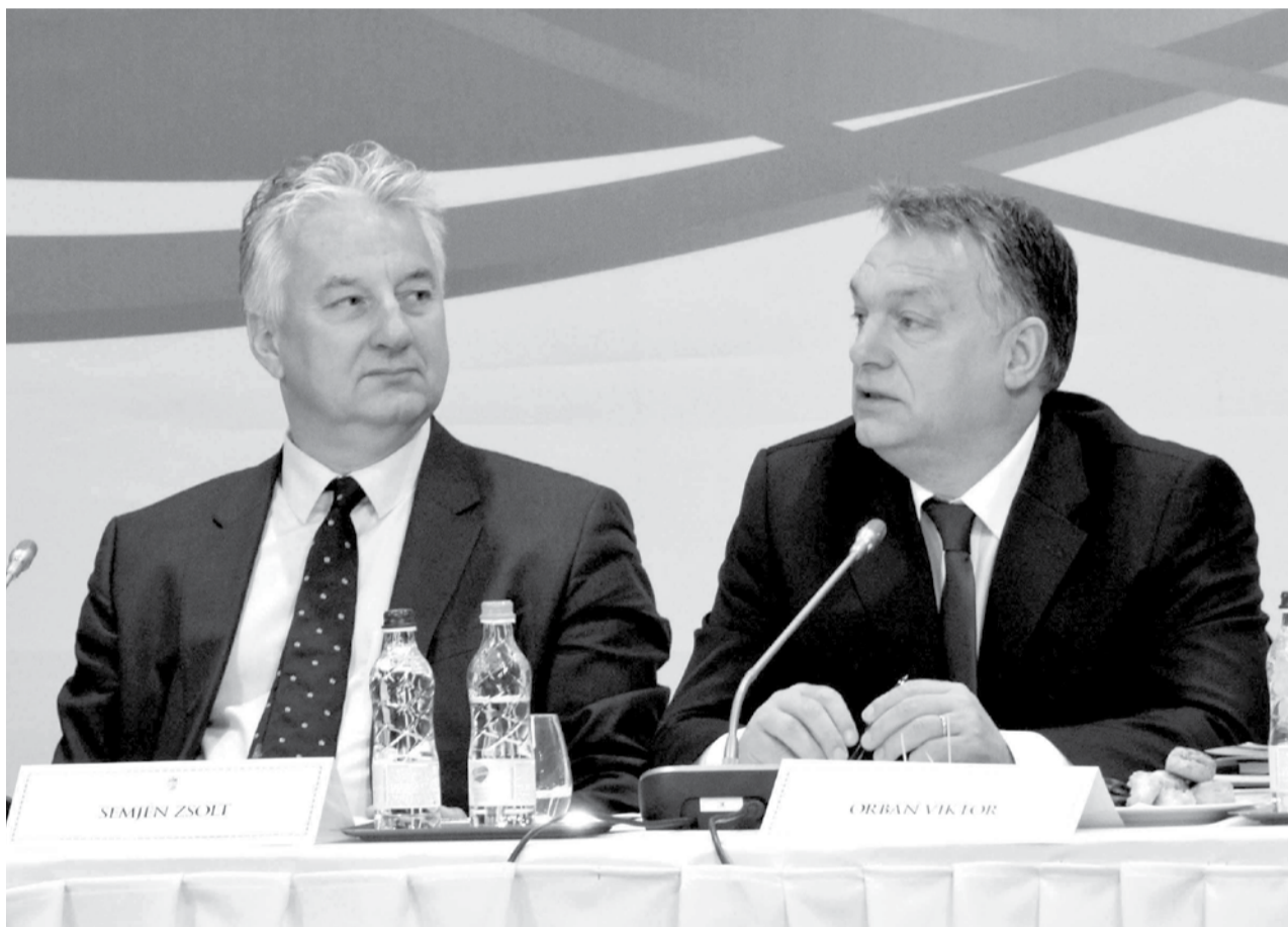
Orbán Viktor (jobbra), Magyarország miniszterelnöke, a Fidesz-Magyar Polgári Szövetség elnöke Semjén Zsolt miniszterelnök-helyetessel, a Kereszténydemokrata Néppárt elnökével

Európában ezt alig sikerült megoldania pártszövetségnek – jegyezte meg Orbán Viktor, hozzáfűzve: az, hogy