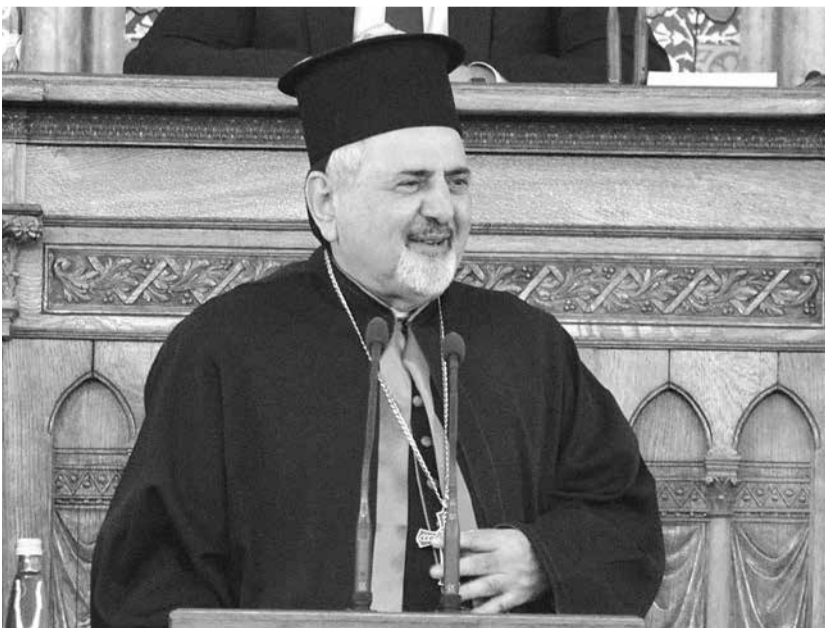
III. József Ignác Júnán szír katolikus pátriárka

III. József Ignác Júnán , az Antiochiai Szír Katolikus Egyház pátriárkája kiemelte: a Közel-Keleten a keresztények helyzete mostanra „a rosszból a még rosszabbra” fordult. Kiállt a klasszikus családmodell mellett és kijelentette: „mi ragaszkodunk a családhoz úgy, ahogy Isten teremtette”. Elismerését fejezte ki, amiért a magyarok büszkék a magyarságukra, a kereszténységükre, és megvédik Európát és a kereszténységet.