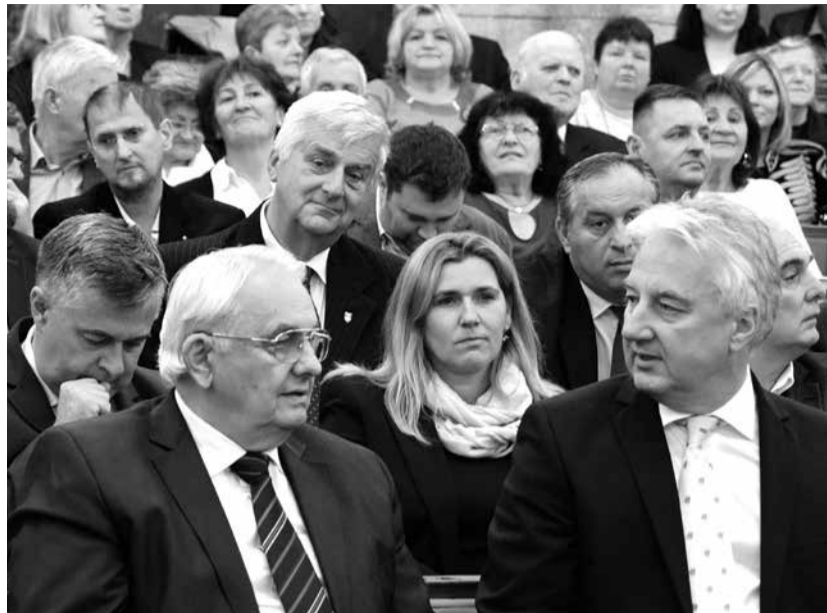
Latorcai János (balra), az Országgyűlés alelnöke, a KDNP Országos Választmányának elnöke és Semjén Zsolt miniszterelnök-helyettes, a KDNP elnöke

Úgy vélte: nincs az az embertelen ideológia, ami ellen eredményesen fel ne lehetne lépni, és nincs az a véleményterror, ami el tudná hallgattatni az igazi kereszténydemokrata gondolatot. Arra figyelmeztetett: továbbra is helyt kell állni és hirdetni kell a sikeres kereszténydemokrata alternatíva értékeit.