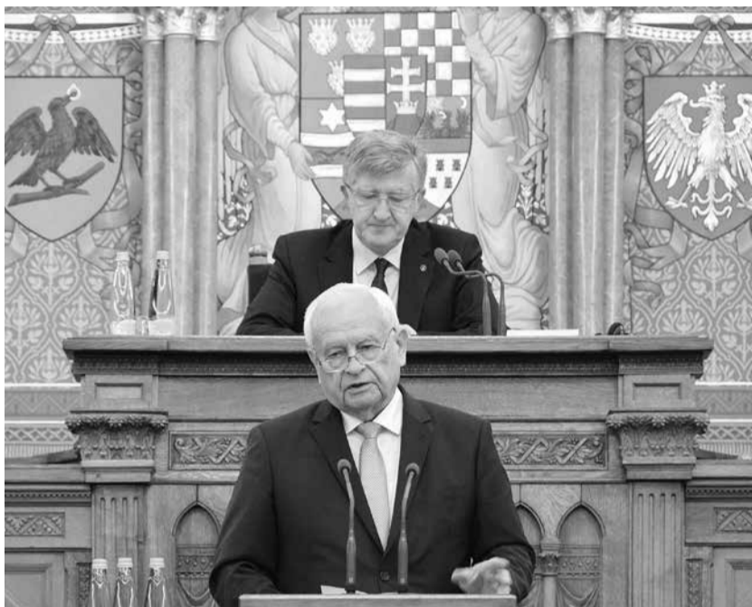
Harrach Péter, a KDNP frakcióvezetője, az MKDSZ elnöke

75 éves a kereszténydemokrácia Magyarországon – ezzel a címmel szervezett ünnepi ülést október 31-ére az Országház Felsőházi termébe a Keresztény Civil Szervezetek Országos Fóruma. A tanácskozás címe egyértelmű utalás egy háromnegyed századdal ezelőtti eseményre: ekkor alakult ugyanis – a német megszállás és a nyilas uralom idején, illegálisan – a Keresztény Demokrata Néppárt. A párt és a hazai kereszténydemokrácia történetéről most dokumentumfilm is készült, melyet a KDNP YouTube-csatornáján lehet megtekinteni, s a kdnp.hu oldalról is elérhető.