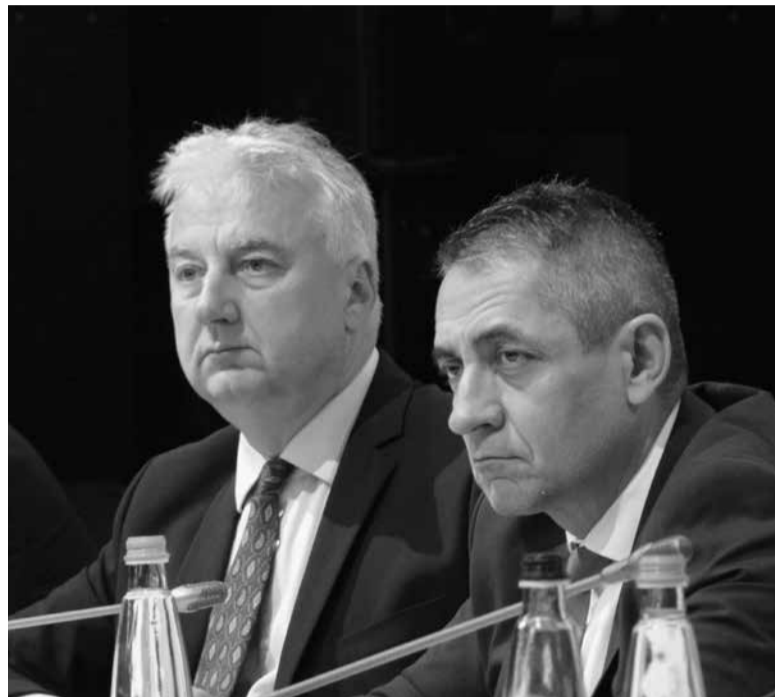
Semjén Zsolt miniszterelnök-helyettes és Potápi Árpád János nemzetpolitikai államtitkár