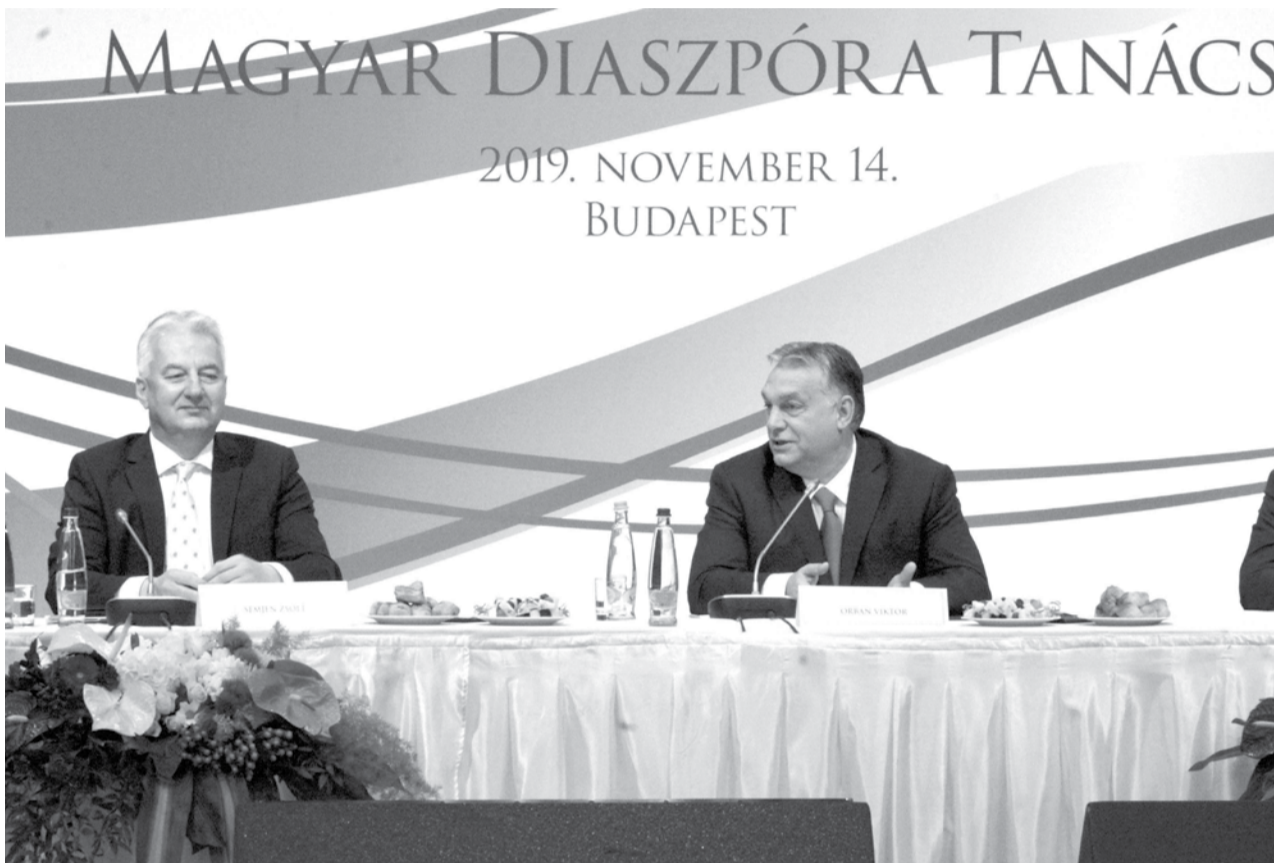
Orbán Viktor miniszterelnök (jobbra) és Semjén Zsolt miniszterelnök-helyettes

A diaszpóra magyarsága 2010 óta azonos súlyú és azonos méltóságú nemzetrész a Kárpát-medence magyarsága mellett – hangsúlyozta Semjén Zsolt nemzetpolitikáért felelős miniszterelnök-helyettes a Magyar Diaszpóra Tanács IX. plenáris ülésén november 14-én Budapesten. Potápi Árpád János nemzetpolitikai államtitkár hozzátette: az idei évben a világ 32 országából közel száz szervezet képviselője volt jelen a Magyar Diaszpóra Tanács ülésén.