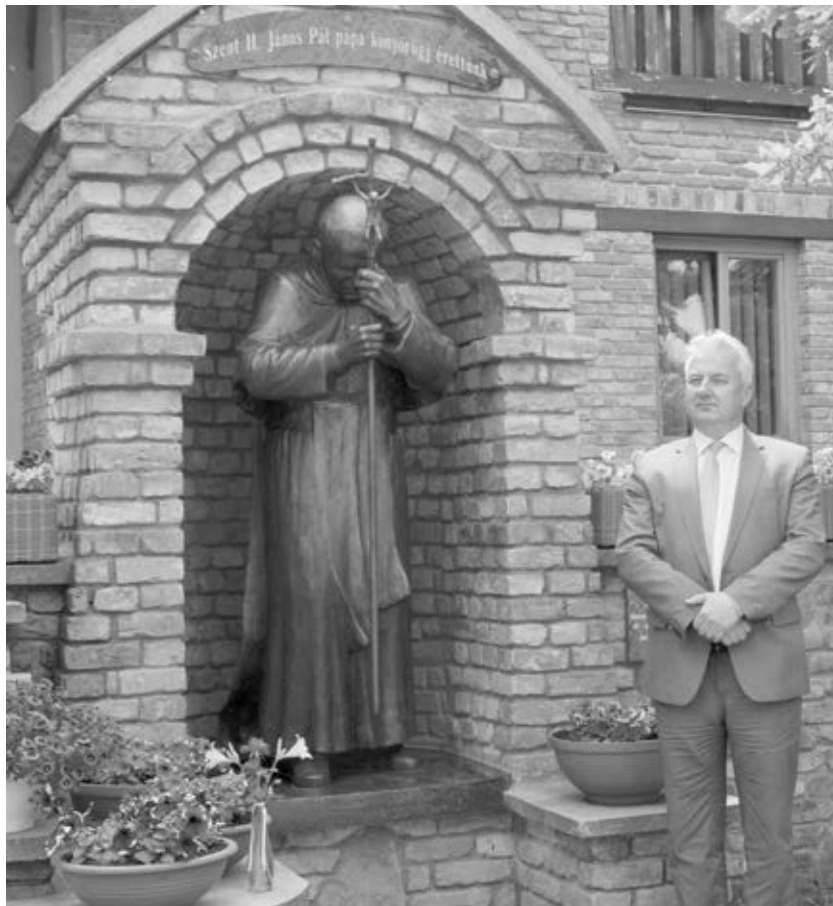
Semjén Zsolt II. János Pál pápa szobrának avatásán 2019 májusában Pülsicscában

A könyv harmadik nagy témájával, a kereszténydemokráciával kapcsolatban elmondta, hogy az nem egyoldalúság, nem valaminek a leszűkítése. A kereszténydemokrata értékrendben a személyiség és a közösség értékei eredeti egységben vannak.