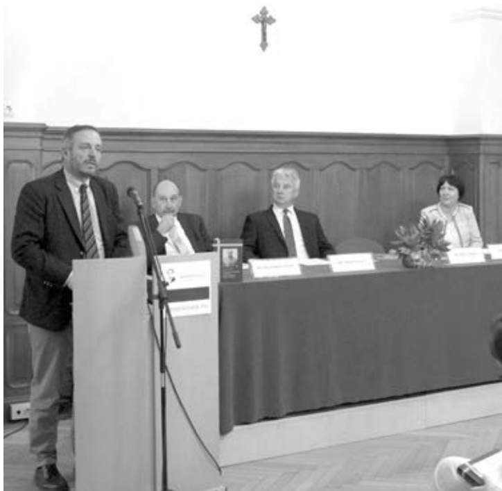
Hölvényi György, a KDNP európai parlamenti képviselője, Mészáros József, a Barankovics Alapítvány kuratóriumi elnöke, Semjén Zsolt miniszterelnök-helyettes, a KDNP elnöke és Petrás Éva történész, a kötet szerkesztője

küzdöttek ugyanezek az emberek az emigrációból, amerikai egyetemeken, könyvtárakban és szerzetesi szobákban, hogy megőrizzék az európai és magyar értékeket. A könyvből kitűnik, hogy a kereszténydemokrata gondolkodás alapja az ember teremtett volta. A könyv másik sajátossága az a felelősség, amit szerzője a magyar nép