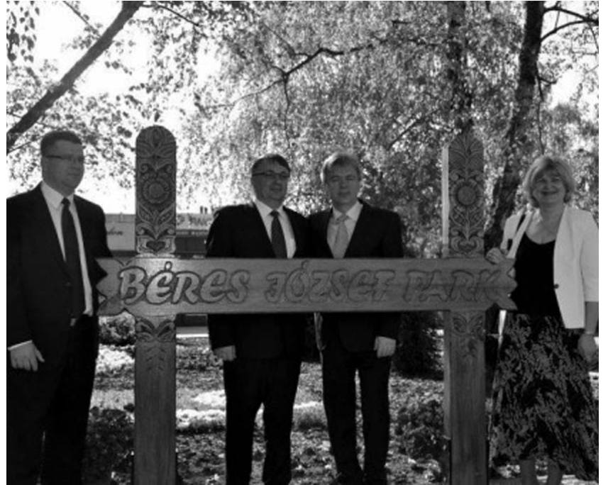
A 40 éves Béres csepp évfordulás ünnepségén, Kisvárdán, május 2-án

– A legnagyobb bajunk valóban az, hogy nincs egy minimum, amit mindannyian betartanánk. Nincsenek „szent” dolgaink, amelyekhez mindannyian egyként viszonyulnánk. Sok-