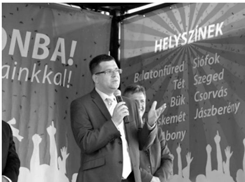
A COOP Olimpiai Road Show, Kisvárdán május 7-én

– Sűrű évek, kemény munka. 90-ben a nagybátyám Szabolcs-Szatmár-megyei KDNP-s képviselőként bejutott a parlamentbe. Én akkor huszonkét éves voltam, és végigasszisz-