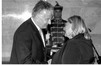
FORRÁS: KDNP.HU, MTI

Minden nemzet egyszeri és megismételhetetlen érték – emelte ki Semjén Zsolt, miniszterelnök-helyettes, a KDNP elnöke a Kisebbségekért díj átadásán az Országházban. A nemzetpolitikáért felelős miniszterelnök-helyettes azt mondta: nemcsak saját nemzetünknek, hanem az egész emberiségnek tartozunk azzal, hogy a saját kultúránkat, történelmünket, nyelvünket megőrizzük. Különösen így van ez a nemzetiségi részekben az egyes területek, tájegységek és a sajátos történelmi régiók örökségével.