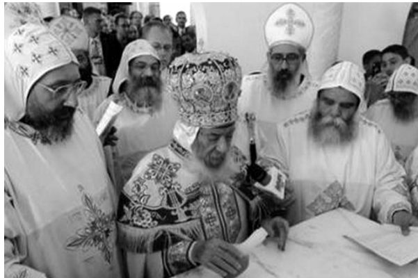
III. Senuda a kopt keresztény egyház püspökeivel augusztus 21-én felszentelte a kopt keresztény közösség első magyarországi templomát Budapestén

A miniszterelnök-helyettes a történelmi végzettségű egyházi vezetőről szólva elmondta, hogy rendkívüli műveltségű, a nyugati kultúrában is otthonosan mozgó személyiség. 1956 és 1962 között teljes remeteségbe vonult, majd 1971-ben választották pápává. Az akkori hatalom 1981-1985 között száműzte, kolostorban élt.